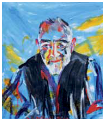
Kurt Schwertsik, Öl, 2001, 70x80