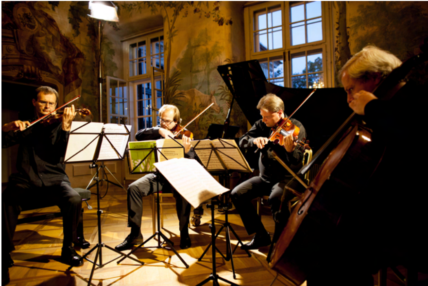
aron quartett, 2015